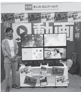
(株)シンカ・ コミュニケーションズ