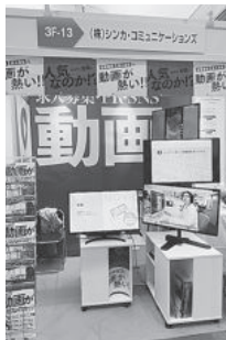
(株)シンカ・コミュニケーションズ

商工会青年部の企画運営、商工会が主催する「One Love Festa 河内長野市商工祭2022」が11月20日(日)に、寺ヶ池公園で開催された。開催当日は前日までの雨天予想に反して、曇り時には晴れ間も見えた天候となった。1万4千人の来場者を迎え、無事イベントが終了した。 寺ヶ池公園内特設ステージでは、楽器やバンド演奏、各種ダンス、お店のPRタイムやテレビで人気のキャラクターとのふれあいなどが行われ、大人も子供も熱い視線を送り、歓声を上げ、笑いに包まれた。 ステージのほか、高所作業車の展示と職業体験、ワンラブマーケットや市内の飲食店・団体が多彩な模擬店を出し、企業・店舗のアピールをし、来場者のお腹と心を満たした。 また、公園内一か所に「エコステーション」というテントを設置し、ボランティアスタッフがゴミの分別収集と資源リサイクルの啓発を行った。結果、会場内に無断でゴミを捨てる人も少なく、来場者にゴミや環境問題について、理解していただくことができた。 様々な催しを寺ヶ池公園に集約し、会場は一時、人であふれるほどにぎわって大人や子供達の笑顔で溢れていた。