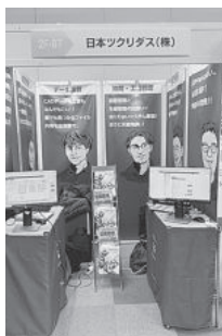
日本ツクリダス(株)