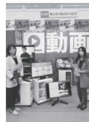
(株)シンカ・コミュニケーションズ

◎「大阪勧業展2022」 開催日時…10月12日(水)・13日(木) 来場者数…8677名 出展企業数…340社・団体 当会より「(有)浦野製作所」 「(株)シンカ・コミュニケーションズ」 2社出展されました。