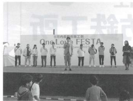
One Love Festa