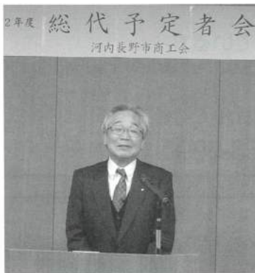
井戸会長 開会あいさつ

会長候補者の選出方法は、先に説明した推薦委員により選任することを出席の総代予定者全員の承認を得て、議長が推薦委