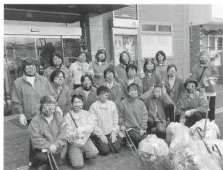
河内長野市内清掃活動