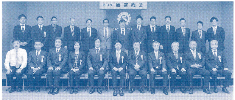
商工会青年部 加入のご案内

本年は、市内産業の活性化を図るための総合研究を行い、新たな商工祭の開催に向けて、青年部らしい企画運営を進めていく予定です。今年度も新たな企画を取り入れ、河内長野市が元気になるような各種事業に取り組んでいきます。